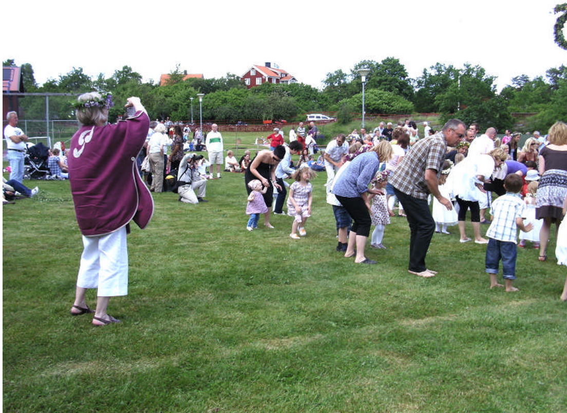
Midsommarfirande med små och stora grodor