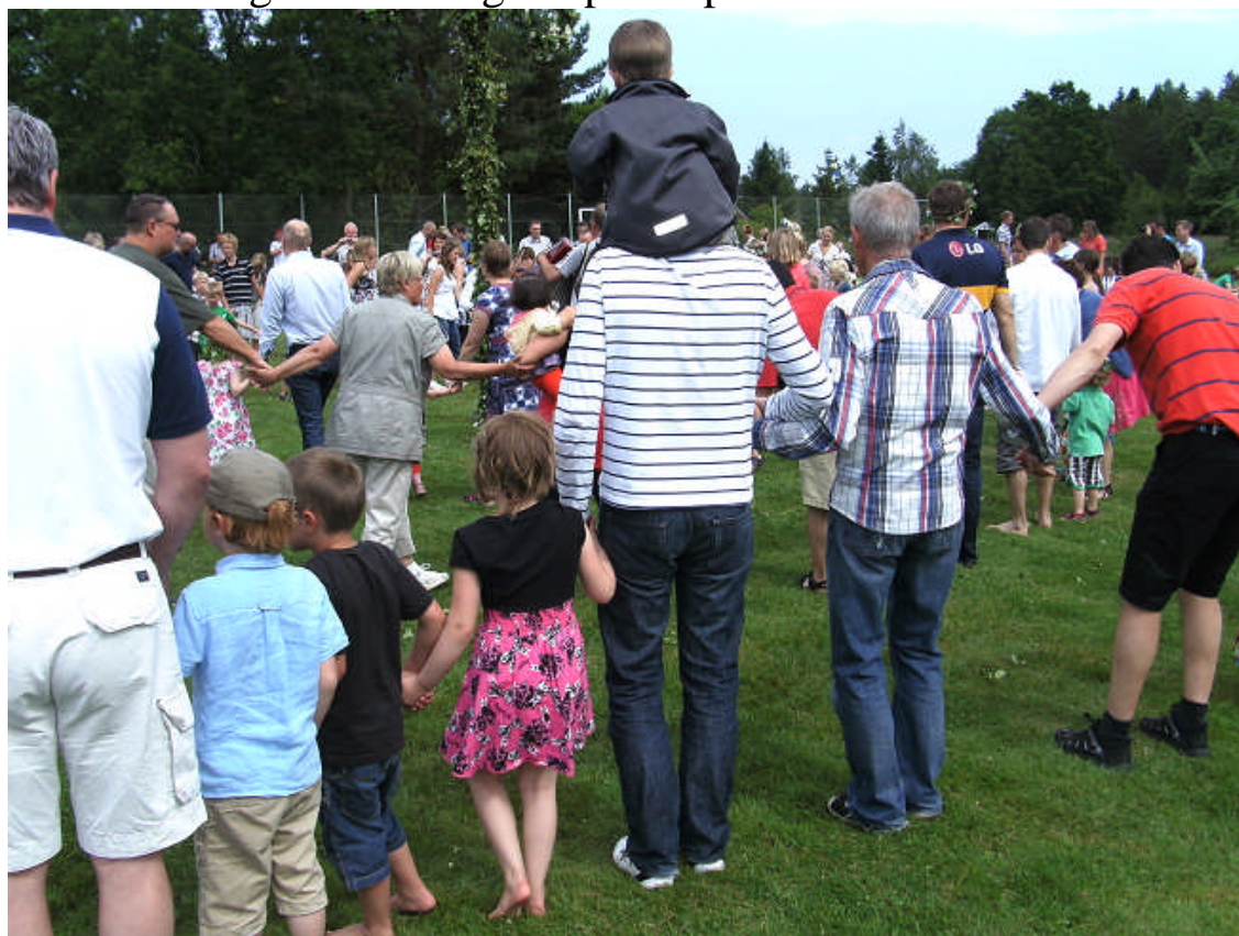
De flitigaste dansdeltagarna var som vanligt barnfamiljerna.