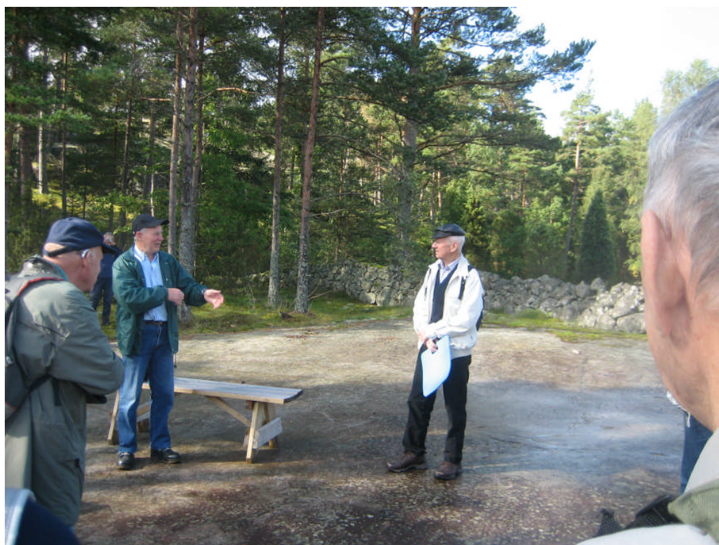
På ”dansbanan” vid Fyrfjärden

Från nedre Fyrtorp, som varsamt har rustats upp jättefint, vandrade vi förbi ”dansbanan” på hällen vid Fyrfjärden. Här ordnades verkliga dans med dragspelsmusik på 20-30-talen med en hel del beväringar som deltagare.