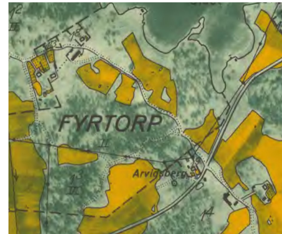
Ekonomiska kartan från år 1946. Lantmäteriet – Historiska kartor

Efter några år köpte Svenska Fritidsbyggen AB byns mark. En byggnadsplan upprättades med mer än 300 fastigheter. Då bildades också fastigheten Snäckevarp 4:1, dvs. den fastighet om nu ägs gemensamt i Snäckevarps Samfällighetsförening.