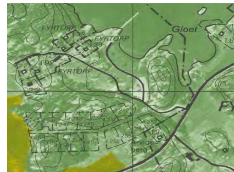
Ekonomiska kartan från år 1975

På kartan från 1946 är det lilla huset som nu finns vid hamnens bryggfäste markerat, men inga båthus syns längre. Den utflyttade gården Nedre Fyrtorp syns längst till höger i kartans nedre del. Markområdet kring byn har fortfarande en ålderdomlig prägel och har inte förändrats mycket sedan laga skiftet år 1840. Det kan noteras att markerna tycks ha varit mer öppna än nu – den ljusgröna färgen markerar öppen mark och det som är mörkare grönt är skog.