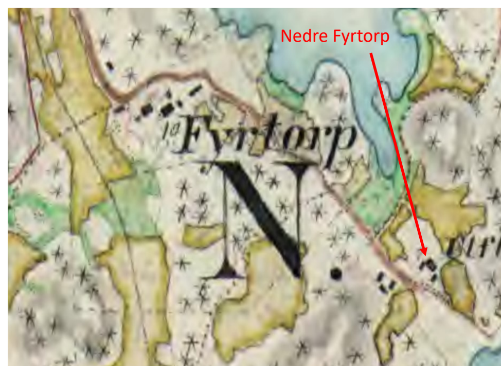
Häradskartan från 1870-talet.

Den utflyttade gården kom att kallas Nedre Fyrtorp och placerades på sydöstra sidan om nuvarande väg 212, mot Horsviken. Kartan från 1870-talet visar den utflyttade gården. Den är markerad längst ner till höger på kartan.