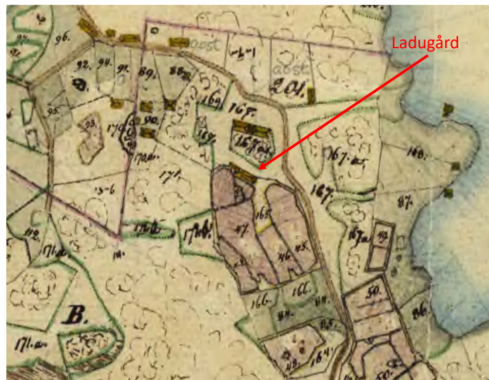
Karta till Laga skifte år 1840. Lantmäteriet – Historiska kartor

År 1840 förrättades Laga Skifte i Fyrtorps by. För att åstadkomma bättre brukningsmöjligheter bestämdes att en av gårdarna skulle flyttas. Dess byggnader monterades ner och flyttades.