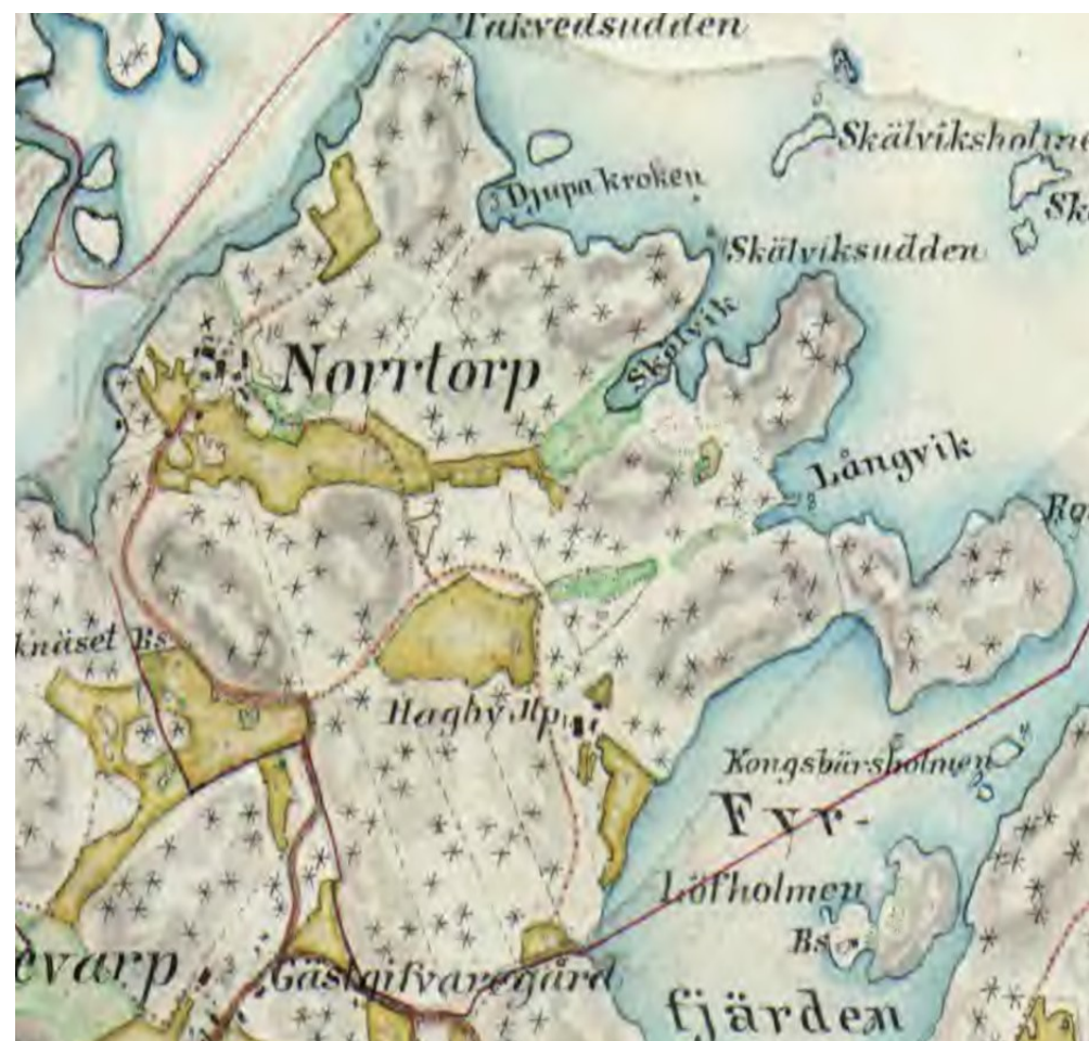
Häradskarta ca 1875. Lantmäteriet – Historiska kartor

Utöver gården fanns det på Norrtorps ägor flera torp; Tovebo, Kälet, Mörkebås och senare Hagby. De som bodde på torpen ägde inte marken utan betalade arrende (hyra) till ägaren. Det var i allmänhet en större gård. Arrendet betalades ofta i form av dagsverken, dvs. man arbetade på gården. Detta system förbjöds år 1943.