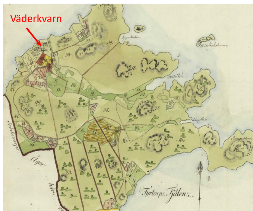
Karta från storskifte år 1807

Av kartan från år 1650 framgår att åkerjorden i huvudsak var samlade i två skiften – norra och södra täppan (grå färg på kartan). De låg nära byggnaderna. Ängsmarken fanns utefter nuvarande Takviksvägen, Norrtorpsvägen och Snäckevarpsvägen.