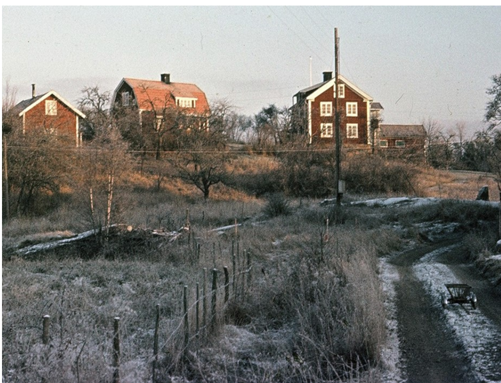
Norrtorp under 1930-talet.

Häradskartan från 1875 visar att väderkvarnen vid mangårdsbyggnaden fortfarande fanns kvar. Den är markerad med ett väderkvarnsmärke.