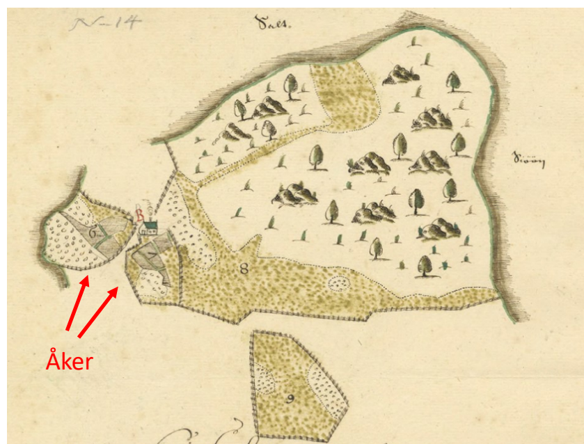
Norrtorps gård år 1650.

Norrtorp var en av de tre gårdarna som tillsammans bildar den fastighet som nu ägs av Snäckevarps Samfällighetsförening. Mangårdsbyggnaderna avstyckades som två separata tomter i samband med exploateringen av området.