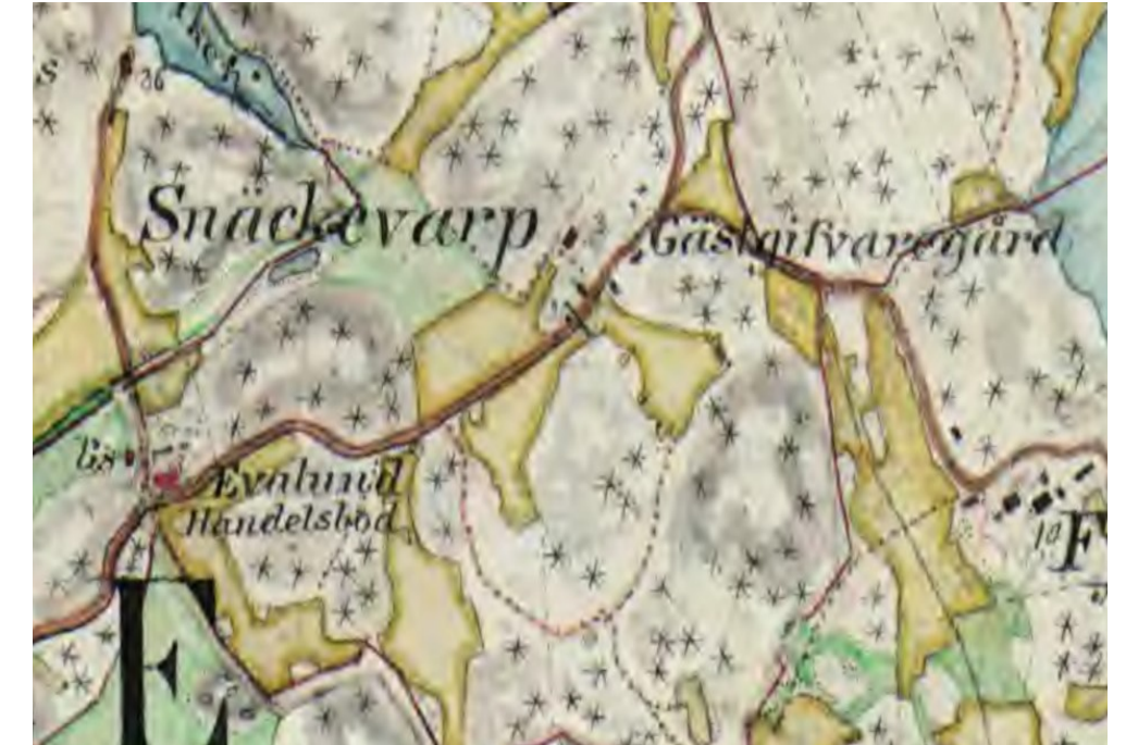
Häradskarta från 1870-talet över Evelund, Snäckevarp och Fyrtorp. Lantmäteriet – Historiska kartor

På kartan från 1806 ses en s.k. båtlänning i Horsviken. Den syns som ett litet grönt område vid vattnet på Fyrtorps mark. Där förvarade gästgiveriet utrustning för resande i skärgården. Notera att på kartan från 1870-talet finns båthuset i Årsviken kvar.