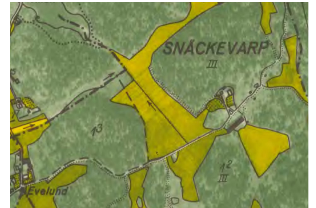
Ekonomiska kartan 1945. Lantmäteriet – Historiska kartor

År 1924 revs de gamla ekonomibyggnaderna som låg ovanför (norr om) milstenen och den nya ladugården byggdes. Denna – den s.k. Snäckevarpsladan – ägs och förvaltas nu av Snäckevarps samfällighet.