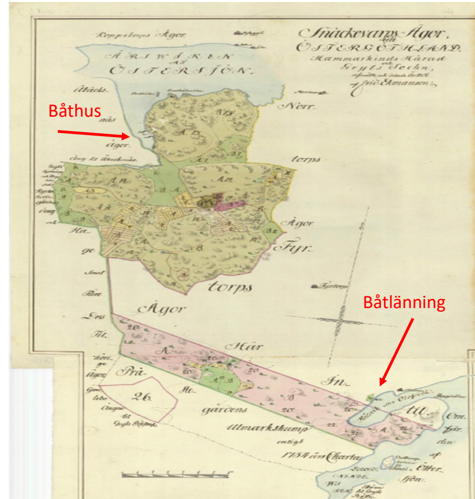
Karta från Storskifte av Snäckevarp år 1806. Lantmäteriet – Historiska kartor

Längst in i Rågetedalen finns två båthus markerade på kartan. Dessa är nu sedan länge rivna.